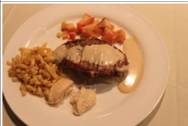
Filet de faisán à la normande