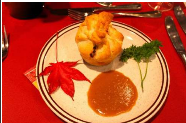
Feuilleté de boudin noir