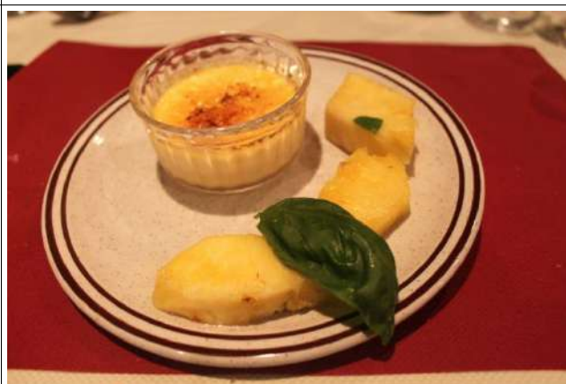
Crème caramélisée au basilic, ananas au basilic