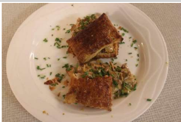
Feuilletés aux chanterelles