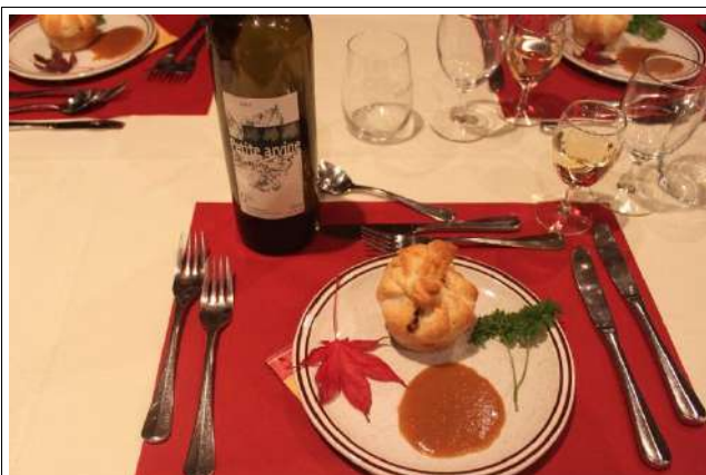
Les vins proposés par Pierrick Suter