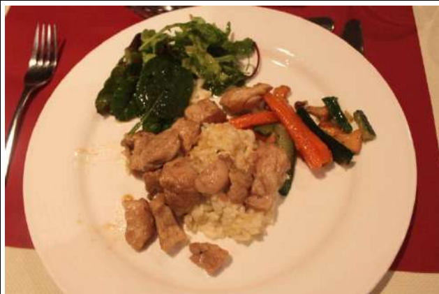
Ris de veau sur lit de risotto