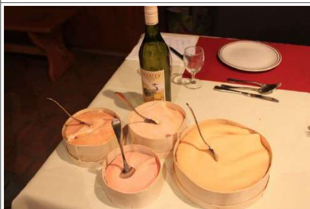
L'assortiment de vacherin Mont d'Or