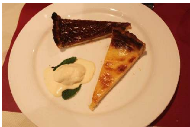
Tarte à la crème, pâte à tarte friable et sucrée au vin cuit de poire