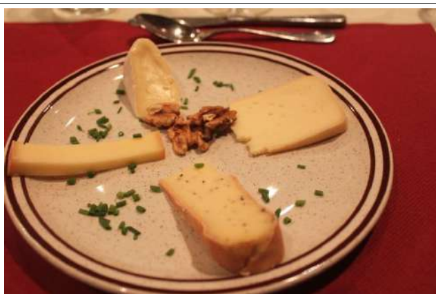
Fromage d'alpage de Loutze