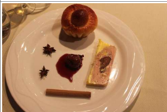
Terrine de foie gras de canard aux figues