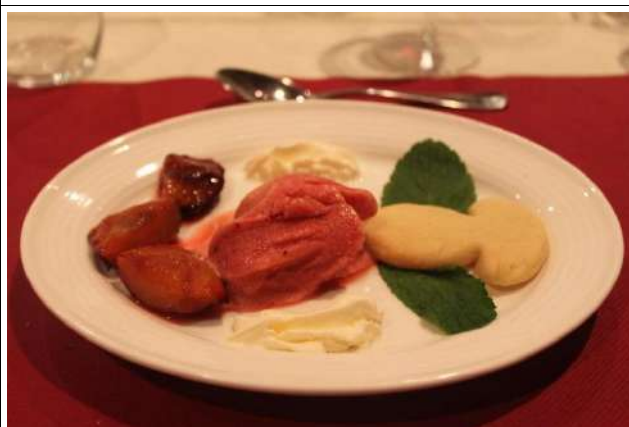
Sorbet aux pruneaux et pruneaux poêlés