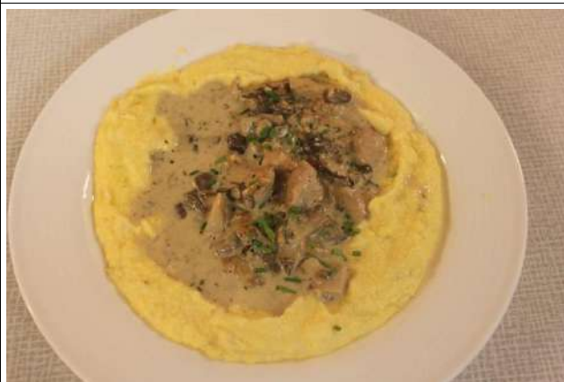
Fricassée de champignons et polenta