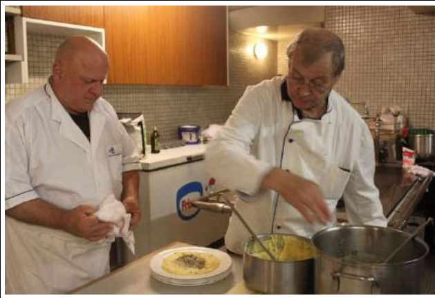
Et si on prenait un peu l'air de la cuisine...